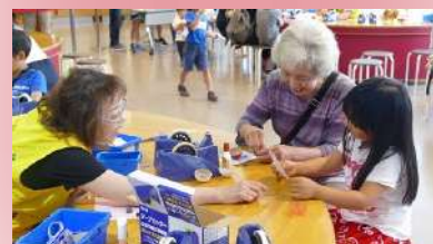
る・く・るナビゲーター活動の様子