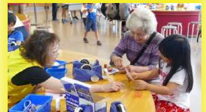
る・く・るナビゲーター活動の様子