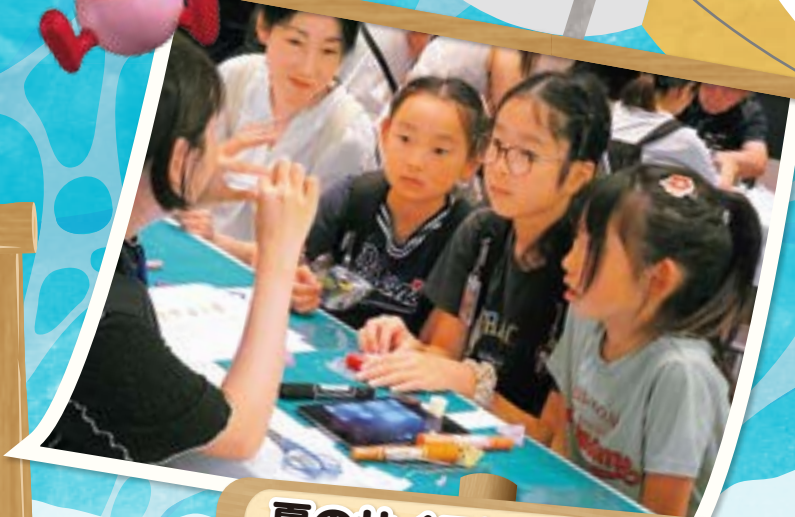
夏のサイエンス屋台村