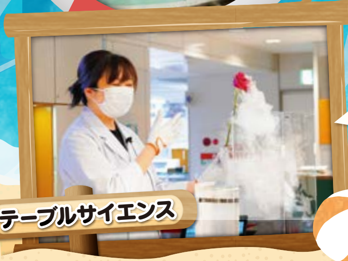
テーブルサイエンス