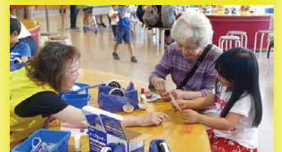
る・く・るナビゲーター活動の様子