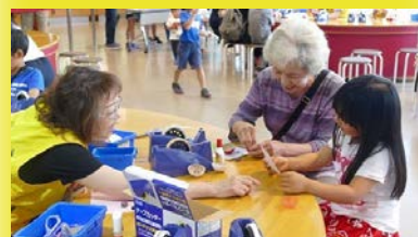
る・く・るナビゲーター活動の様子